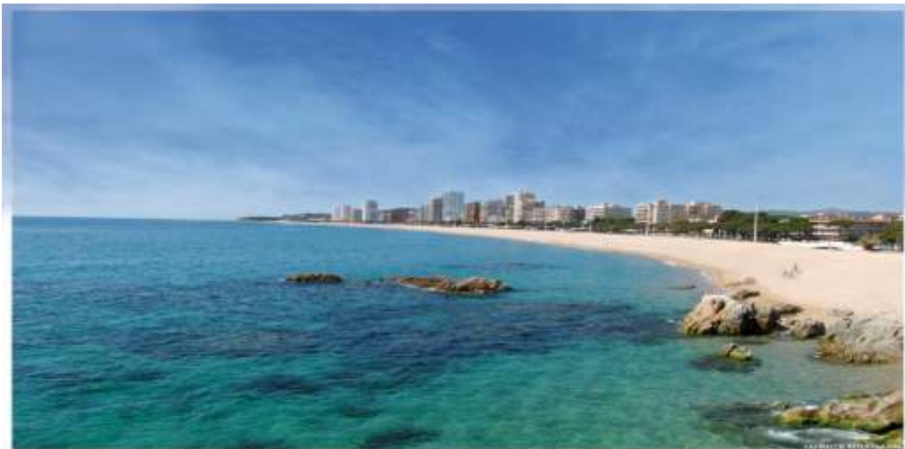
Vue depuis l'hôtel

Pour la 10 ème année, Benoit Bourguet et son équipe vous donnent rendez-vous à Playa de Aro, au nord de l'Espagne, sur la Costa Brava. A 100Km derrière la frontière française, cette région est l'endroit idéal pour préparer la saison. Ses eaux cristallines, les petites criques et falaises entourées d'un paysage sauvage rendent les séjours sportifs inoubliables.